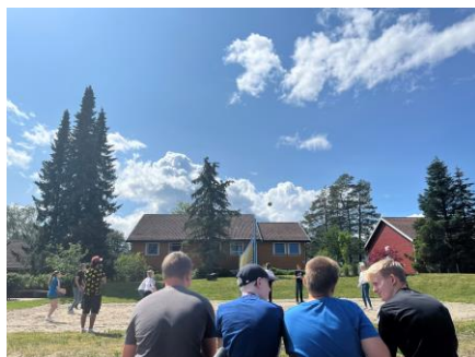
Bildetekst: Aktiviteter på konfirmantleir

Det blir gitt mer informasjon om dette på informasjonsmøtene i juni.